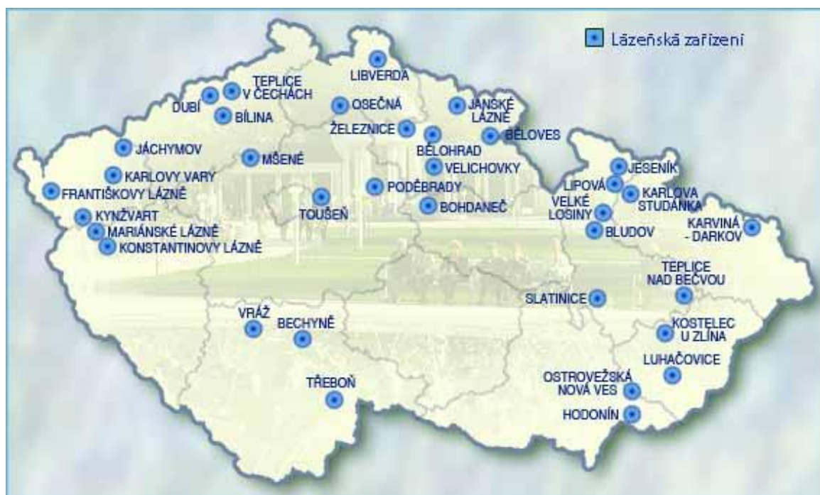
Obrázek č. 1: Přehled lázeňských míst v ČR